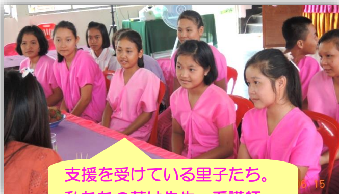
支援を受けている里子たち。 私たちの夢は先生。看護師。

中学校は義務教育ですが、寄宿舍は政府からの援助はなく、山にある集落のほとんどが貧しい家庭で勉強を続けることは簡単ではありません。