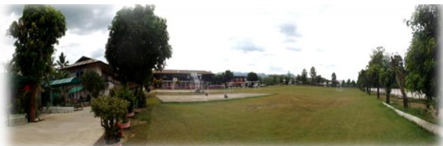
バンファイシン学校